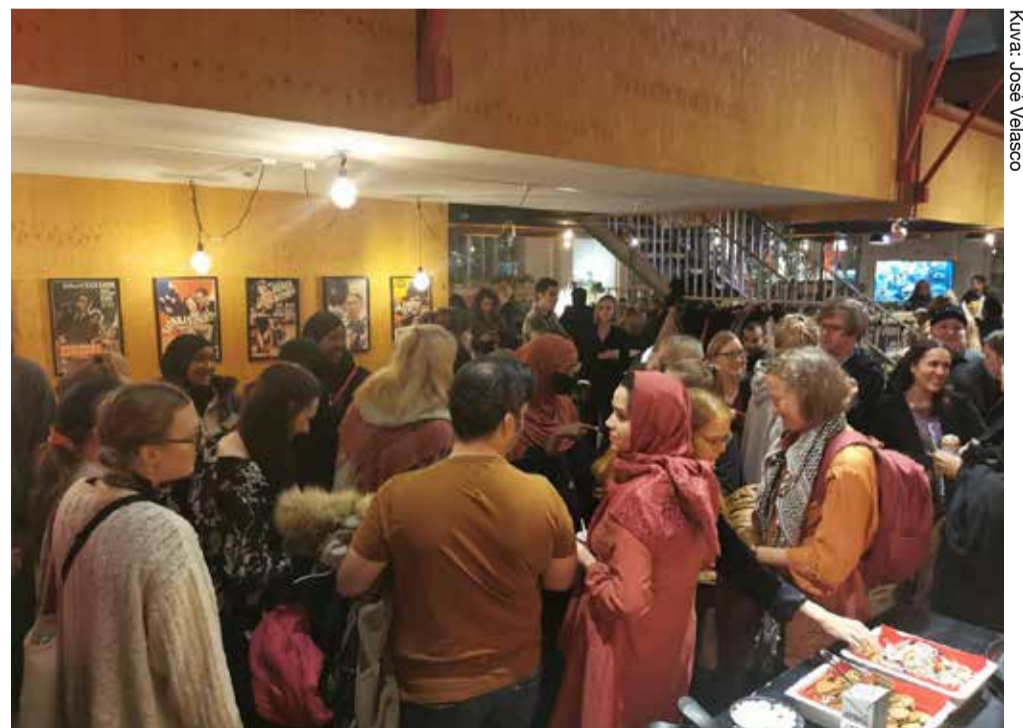
Maksuton kahvila on muodostunut tärkeäksi kohtauspaikaksi ja kiristynvä maailmanpoliittisen tilanteen keskellä sillä on ollut jopa sielunhoidollisia ulottuvuuksia.