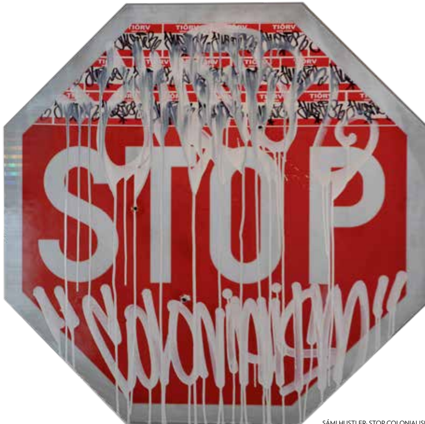
SÁMI HUSTLER: STOP COLONIALISM